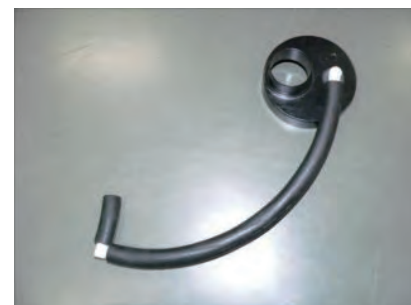
L型ニップルにホース(短)を取り付けます。