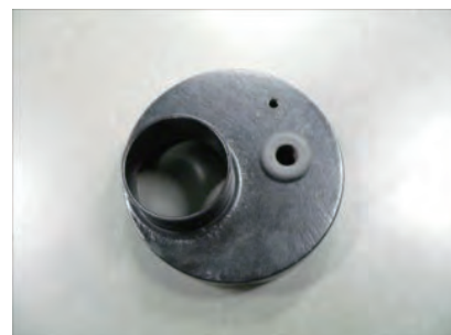
アダプターにグロメットを取り付けます。