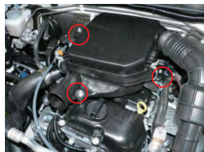
フィルターボックスのボルトを3箇所外します。