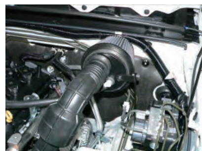
アダプターとステーをビスAで取り付けます。