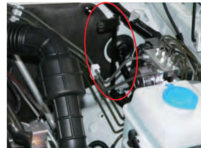
その孔にステーを固定します。 (純正ボルト使用)