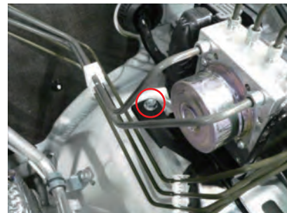
赤丸印のボルトを一度外します。