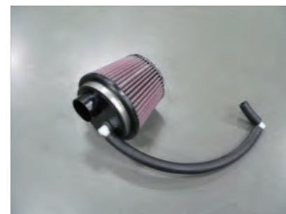
アダプターにエレメントを取り付けます。