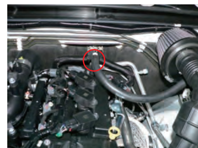
ホース(短)をエンジンに取り付けます。