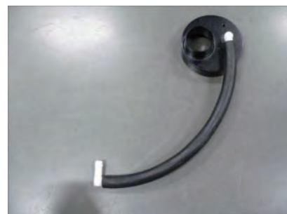
ホース(長)にL型ニップルを取り付けます。