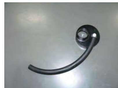
L型ニップルにホース(長)を取り付けます。