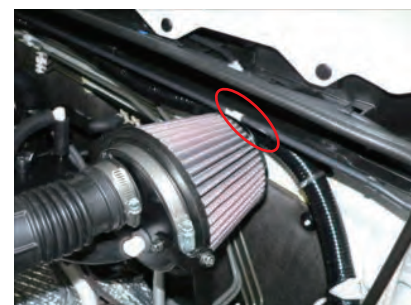
エレメントとボディのクリアランスが少ないため、クッションテープを貼り付けます。