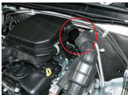
ホースバンドを緩めてサクシジョンホースを外します。