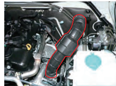
サクシジョンホース根本のホースバンドを緩め、サクシジョンホースを回転させます。