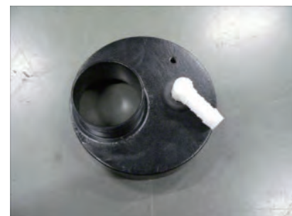
グロメットにL型ニップルを取り付けます。