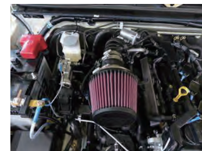
13. エレメントを取付けバンドすべてを締め付け、取付け完了です。