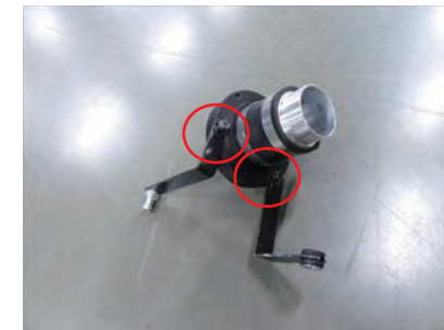
10. ステア A とステア B を上部写真の様にビス A x2 で取付けます。ここではステアは仮留めにします。