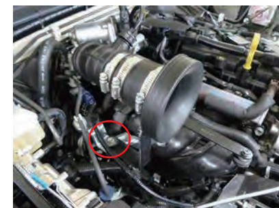
12. ステア B を純正のワッシャー付きボルトで固定し、ステアすべてを本締めします。