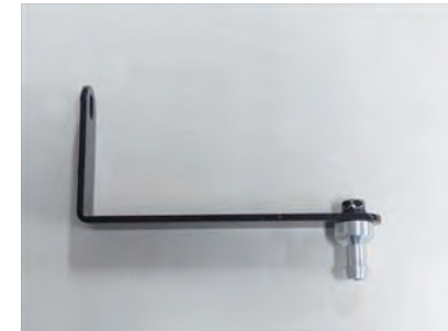
6. ステア A にビス B とアルミスタッドを上部写真の様に取付けます。