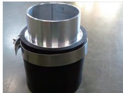
8. ラバーホースとアルミパイプの段差が面一になる様に取付けます。