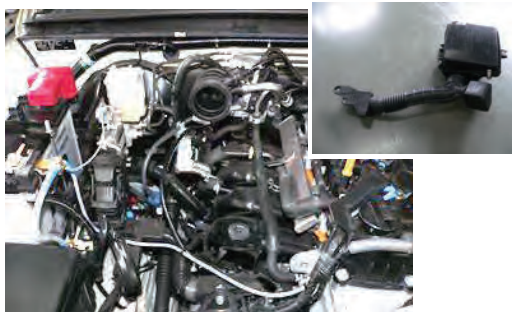
3. エアクリーナーボックスを取外します。