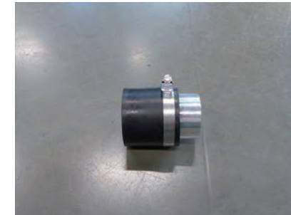
7. ラバーホースにアルミパイプを差し込み、ホースバンド x1 で仮留めしておきます。