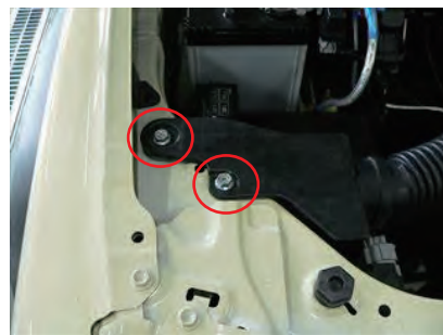
2. ボルトを 2 カ所を取外します。