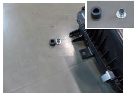
4. エアクリーナーボックスからゴムブッシュとカラーを 1 個取外します。