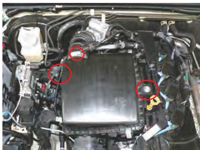
1. ボルトを 2 カ所取外し、バンドを緩めます。