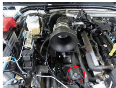
11. アダプター ASSY をサククションホースに差し込みアルミスタッドを純正ゴムブッシュに差し込みます。