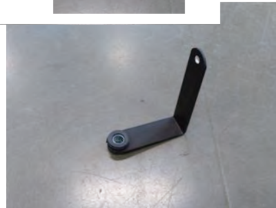
5. ステア B に外したゴムブッシュとカラーを取付けます。