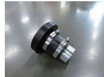
9. ラバーホースとアダプターをバンド x1 を使用し固定します。