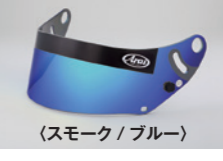
(スモーク / ブルー)