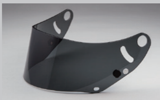
GP-6 シールド (スモーク) FIA 公認ラベル付