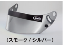
(スモーク / シルバー)