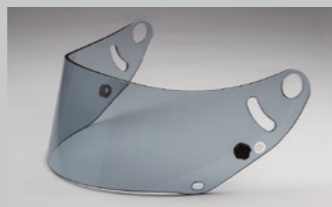
GP-6 シールド (ライトスモーク) FIA 公認ラベル付