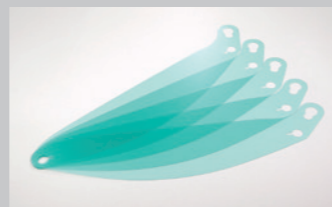
GP-6 ティアオフシールド (5枚1組)