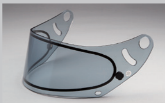
GP-6 ダブルレンズシールド (ライトスモーク) FIA 公認ラベル付

GP-6 8859 ミラーシールド FIA 公認ラベル付 ※写真は同梱のバイザーシールドを装着しています。 ※バイザーパネル取付けのために、シールド上部のミラーコーティングはしてありません。