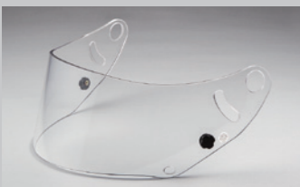
GP-6 シールド (クリアー) FIA 公認ラベル付