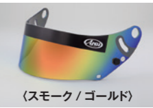
(スモーク / ゴールド)

GP-6 8859 ミラーシールド FIA 公認ラベル付 ※写真は同梱のバイザーシールドを装着しています。 ※バイザーパネル取付けのために、シールド上部のミラーコーティングはしてありません。