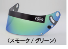
(スモーク / グリーン)