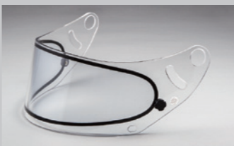
GP-6 ダブルレンズシールド (クリアー) FIA 公認ラベル付