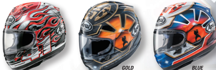
HAGA (ハガ) (つや消し) PEDROSA SAMURAI SPIRIT (ペドロサ・サムライスピリット) (つや消し) PEDROSA SAMURAI SPIRIT (つや消し)