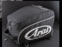
専用ヘルメットバッグ RX-7X SRC/VZ-RAM SRC共通