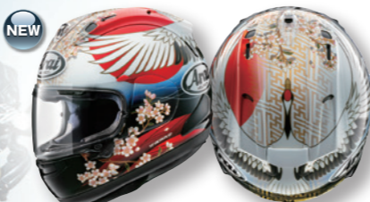
PB-SNC 2 RX-7X TSUBASA (ツバサ)