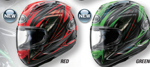
PB-SNC 2 RX-7X RADICAL (ラジカル)