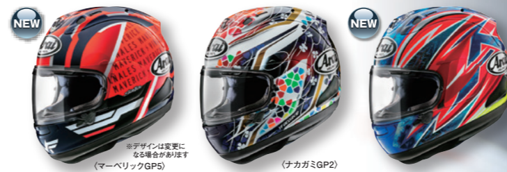
MAVERICK GP5 (マバーリックGP5) *デザインは変更になる場合があります NAKAGAMI GP2 (ナカガミGP2) OGURA (オグラ)

シールド VAS-V MV ピンロック 装着可能(別売) 内装タイプ フルシステム内装