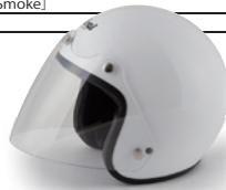
ニューコンペシールド (クリアー) [NEW COMPETITION SHIELD]