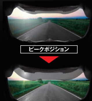
ピークポジション