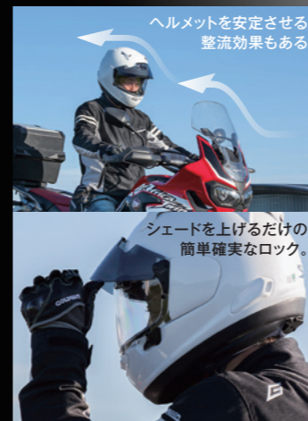
ヘルメットを安定させる 整流効果もある

シェードがヘルメット内に組み込まれていない後付けタイプなので、すべてのモデル(*)に装着可能。いつものヘルメットに、プロシェードシステムを装着して「ツーリング走行」、ある時は標準シールドに付け替えヘルメットを軽量にして「スポーツ走行」を楽しむ、など用途に合わせた使い分けもできる。