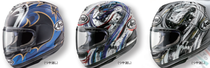
NAKASUGA 21 (ナカサガ21) (つや消し) KIYONARI TRICO (キヨナリ・トリコ) (つや消し) KIYONARI (キヨナリ) (つや消し)