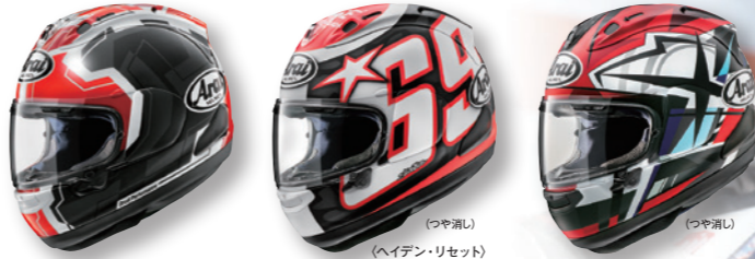
REA SB2 (レアSB2) (つや消し) HAYDEN RESET (ヘイデン・リセット) (つや消し) TAKUMI (タクミ) (つや消し)